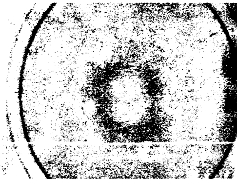
Рис. 3. Рентгенодифракционная картина ЛЖК-системы с ориентированными доменами и широкой доменной границей.